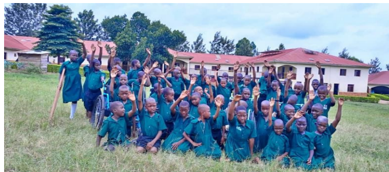
KINDER IN DEN SCHULEN FÜR KINDER MIT

Dies ist eine sensible Abteilung mit 564 direkten Begünstigten, die an den unten aufgeführten 8 Standorten untergebracht sind; ein weiterer Standort, Kakumiro, wird 2026 mit 40 Kindern den Betrieb aufnehmen, sodass insgesamt 5.596 Kinder in der Datenbank erfasst sind. Alle diese Kinder haben von verschiedenen Programmen der Abteilung profitiert, darunter Physiotherapie, Ergotherapie