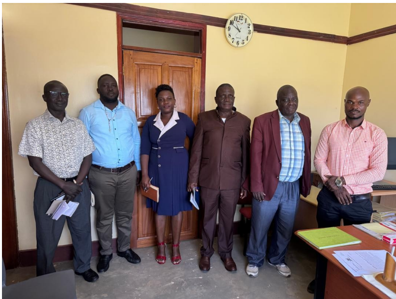
ACFC-FÜHRUNGSTREFFEN MIT DEM ÖSTERREICHISCHEN VORSTAND