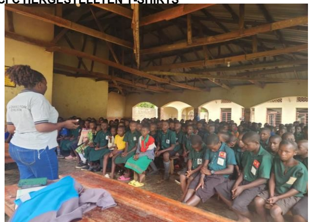
BETONUNG DER DISZIPLIN DURCH BERATUNG