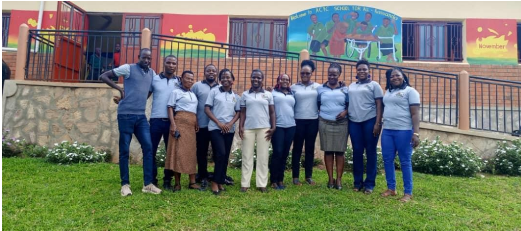
TEAM DER LEITENDEN LEHRER FÜR BESONDERE BEDÜRFNISSE ZUSAMMEN MIT DEM KOORDINATOR

sowohl körperlich behinderte als auch nicht behinderte Kinder aufnehmen, um die Inklusion zu fördern. Zwei Stationen, Kasambya und Kakumiro, wurden hinzugefügt