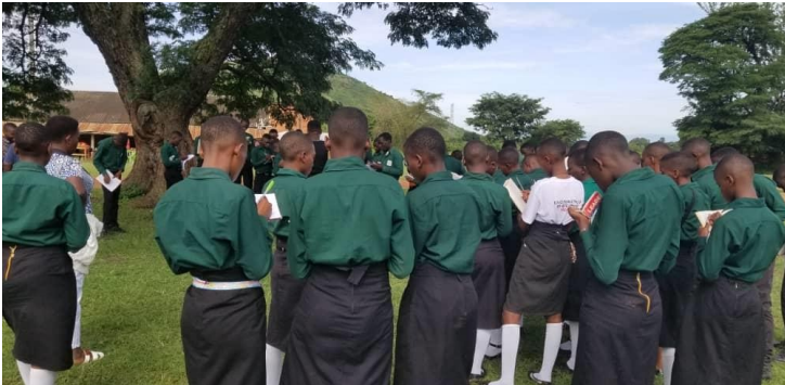
SCHÜLER BEI DER BESICHTIGUNG

✓ Beide Schulen sind als Prüfungszentren für die UCE-Prüfungen (O-Level) registriert. Beide Schulen bieten berufsbildende Fächer an, und die besten Schüler können am Ende der Oberstufe S3 die UVTAB-Prüfungen ablegen.