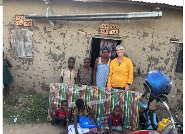
ACFC SORGT DAFÜR, DASS SCHÜLER IHREN ABSCHLUSS ERHALTEN