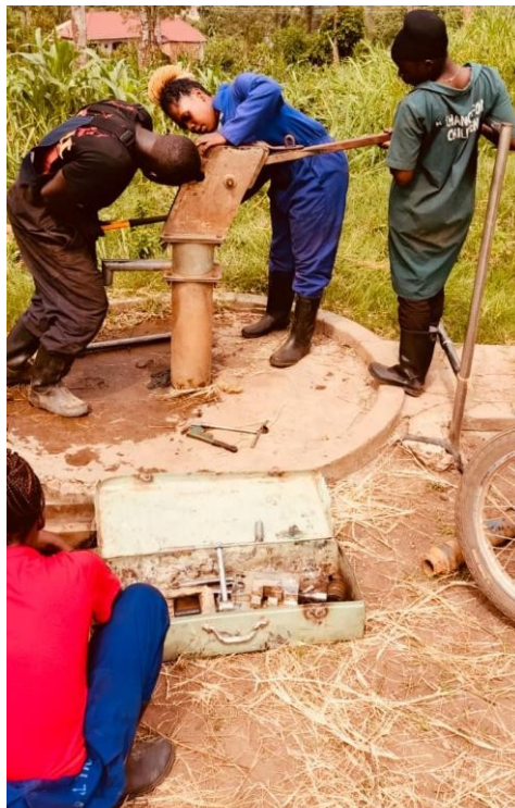
EINE DER SANIERTEN WASSERQUELLEN ZU DEN AKTIVITÄTEN

Im Rahmen des Wasserprogramms werden in ländlichen Gebieten Brunnen gebohrt und saniert. Seit Beginn des Programms wurden in verschiedenen Unterbezirken 81 Brunnen gebohrt, die den Gemeinden helfen, sauberes Wasser zu erhalten und die Fehlzeiten von Schülern aufgrund langer Wege zum Wasserholen zu verringern. Alle Brunnen werden auf Gemeindeland gebohrt, und jede Gemeinde muss ein Wasserkomitee bilden, das für die Pflege der Brunnen zuständig ist und unserem Team bei Problemen Bericht erstattet.