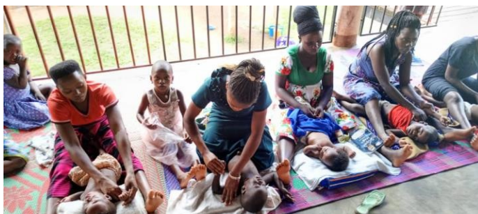
BETREUER UND DIE KINDER BESONDEREN BEDÜRFNISSEN IN DEN FERIENLAGERN