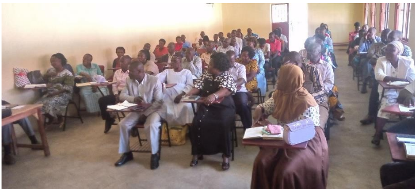
TREFFEN DER LEHRER DES PORRIDGE-PROGRAMMS