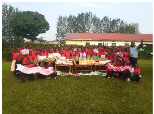
KINDER IM FERIENCAMP

ZU DEN AKTIVITÄTEN UND DIENSTLEISTUNGEN UNSERES SOZIALARBEITSPROGRAMMS GEHÖREN: