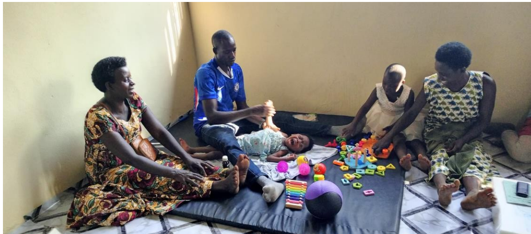
EINER DER THERAPEUTEN BEI DER ARBEIT MIT EINEM KIND