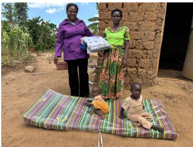
Ein Sozialarbeiter verteilt Bettwäsche