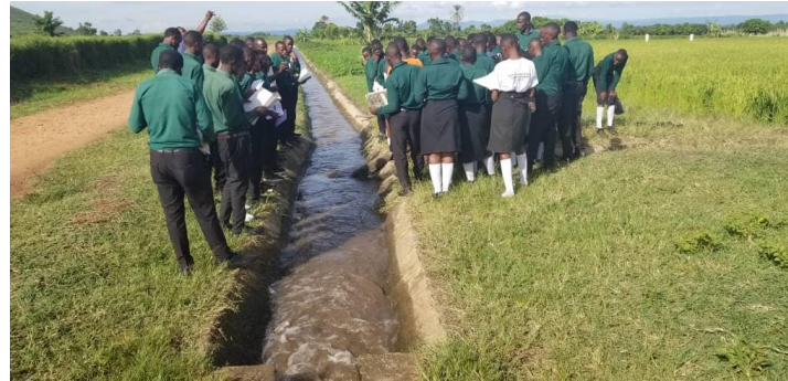
NOCH SCHÜLER AN DER TOUR