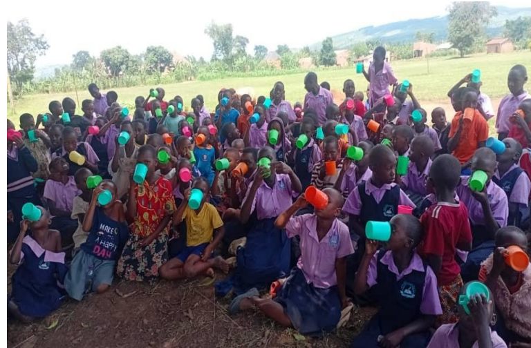
KANNYOGOGA PS NIMMT AM PORRIDGE-PROGRAMM TEIL