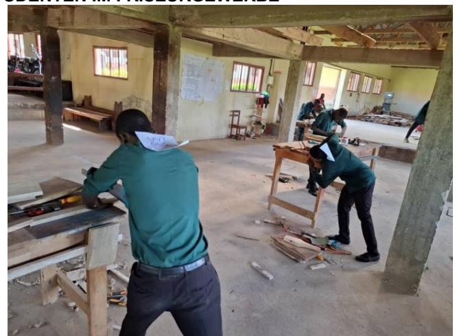
DIT-Studierende erwerben Zertifikate