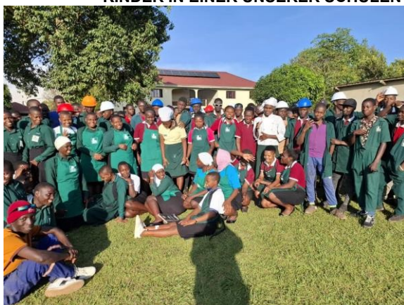
ÄLTERE SCHÜLER IN DER BERUFSVORBEREITUNG