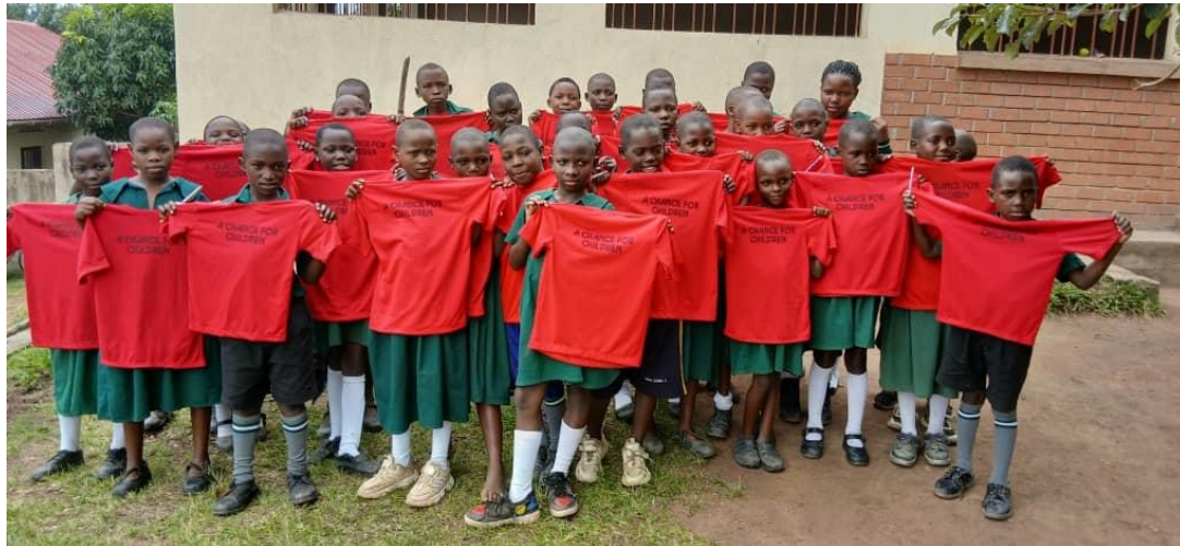
KINDER IN EINER UNSERER SCHULEN MIT VON ACFC HERGESTELLTEN T-SHIRTS

All diesen Kindern werden Schulgebühren, Schulmaterial, Schuluniformen sowie Brei oder Mittagessen in der Schule bereitgestellt. Diejenigen, die in Internaten untergebracht sind, erhalten zusätzliche Unterstützung. ACFC bemüht sich, die Erziehungsberechtigten so weit wie möglich einzubeziehen, und fordert sie auf, die Verantwortung zu übernehmen, wo dies möglich ist.