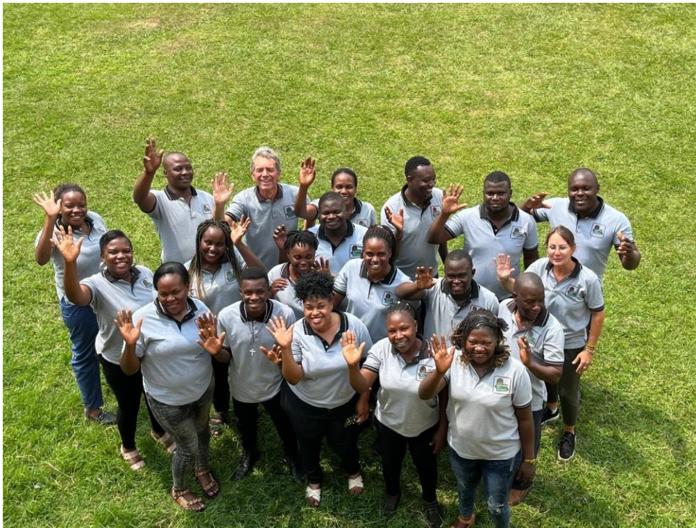
EIN TEAM VON SOZIALARBEITERINNEN UND SOZIALARBEITERN MIT LEITUNG

Sozialarbeiter verbessern das Leben der am stärksten benachteiligten Kinder, indem sie ihnen Zugang zu qualitativ hochwertiger Bildung ermöglichen, soziale und zwischenmenschliche Schwierigkeiten angehen, die Rechte der Kinder fördern und sie vor Schaden schützen. So helfen sie den Kindern, ihre aktuellen Lebensumstände durch Lernen zu verbessern, um sie zu befähigen, ein unabhängiges Leben frei von Armut zu führen, indem sie die Chance erhalten, später einmal Arbeitsplätze zu schaffen statt nur nach Arbeit zu suchen. Um dies zu erreichen, registrieren Sozialarbeiter Kinder, die Unterstützung suchen, führen Hausbesuche durch, und für jede Familie, die unseren Kriterien für Unterstützung entspricht, erfolgt die Aufnahme neuer Kinder das ganze Jahr über.