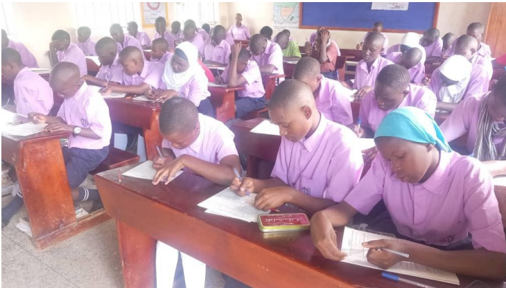
ST. KIZITO NAMIGAVU BEI DEN BOT-PRÜFUNGEN