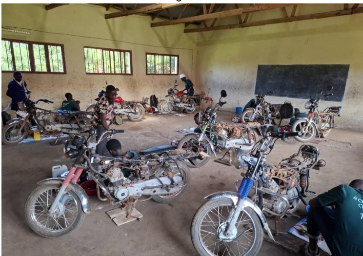
STUDENTEN IM BERFICH MECHANIK

„A Chance for Children“ hat die Möglichkeit erhalten, an diesem Qualifizierungsprozess für junge Menschen in Uganda mitzuwirken. Wir bieten 11 berufsbildende Kurse an, die alle praxisorientiert sind. Und die meisten der Absolventen haben sich erfolgreich in der Arbeitswelt etabliert. Für uns kann jeder Lernende eher ein Arbeitsplatzschaffer als ein Arbeitssuchender sein und sich in Zukunft selbst versorgen.