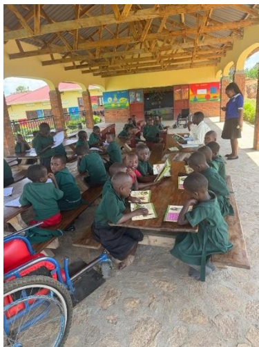
KINDER IN DER SCHULE BÜCHER LESEN