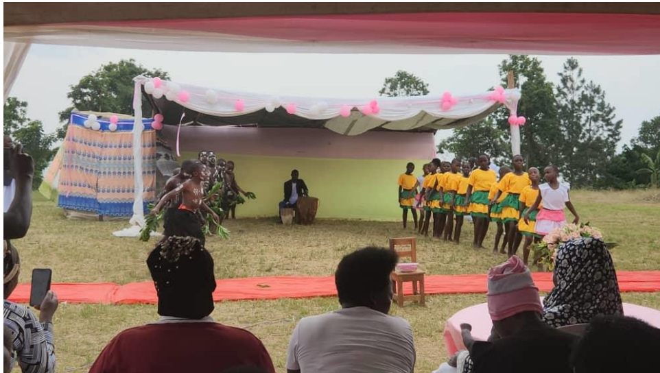
AKTIVITÄTEN IM FREIEN