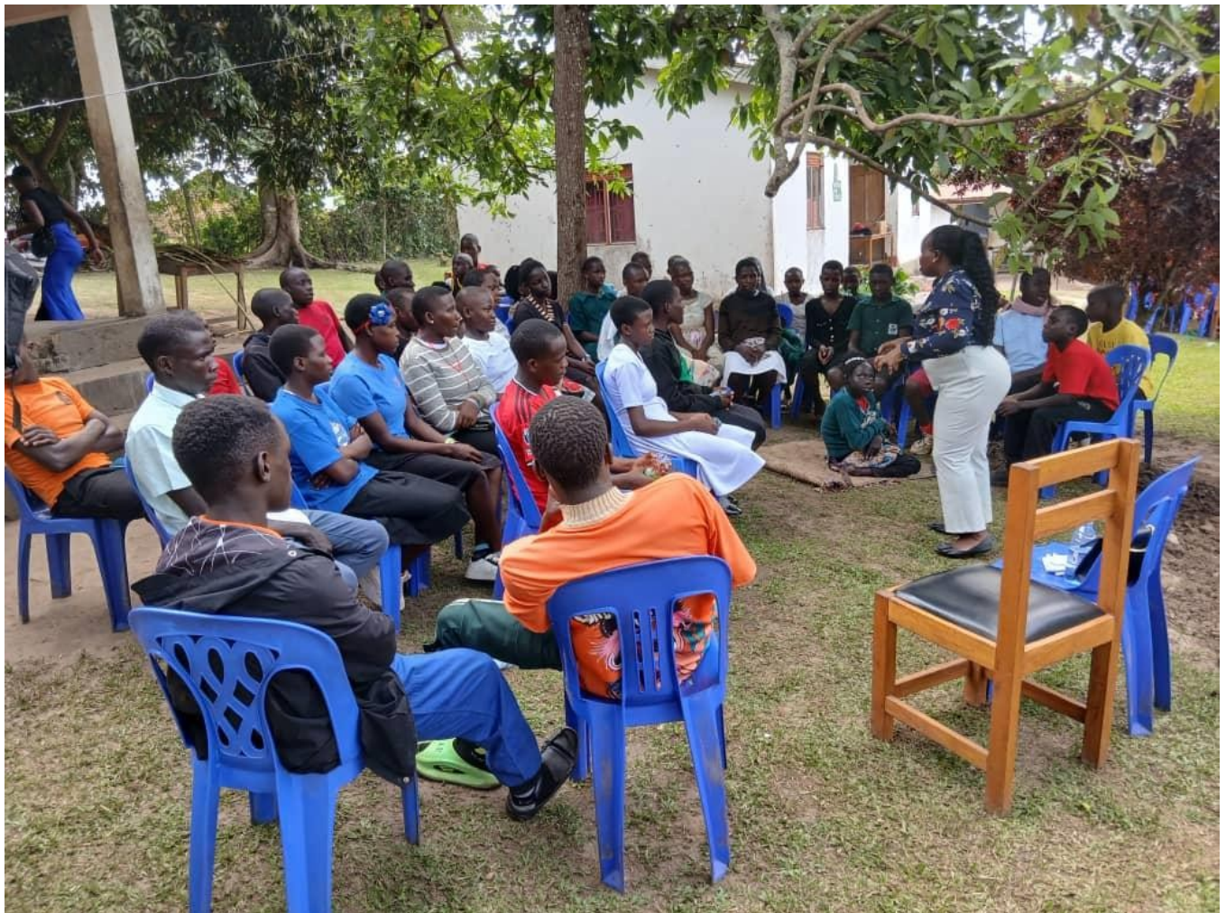
BERATUNG ZUM POSITIVEN LEBEN MIT EINEM BERATER/EINER KRANKENSCHWESTER

Dieses Programm wird derzeit in den Distrikten Mityana, Mubende, Kassanda und Mpigi durchgeführt. Es richtet sich, wie oben erwähnt, an HIV-positive Kinder und einige HIV-positive Mütter. Jeden Monat organisieren wir den Transport zum Krankenhaus, damit sie ihre Medikamente erhalten und von Ärzten untersucht werden können. Wir stellen nahrhafte Lebensmittel bereit (Zucker, Maismehl, Bohnen, Reis, verschiedene Sojasorten und Seife). Unsere Sozialarbeiter führen regelmäßige Hausbesuche durch, um die Hygiene, die Bettwäsche, die Krankenhausbesuche und den Gesundheitszustand zu überprüfen. Im Falle einer schweren Erkrankung, wenn sie ins Krankenhaus eingeliefert werden, übernehmen wir die Behandlungskosten. Dreimal im Jahr während der Schulferien bieten wir spezielle Beratungsgespräche mit Krankenschwestern und Beratern an.