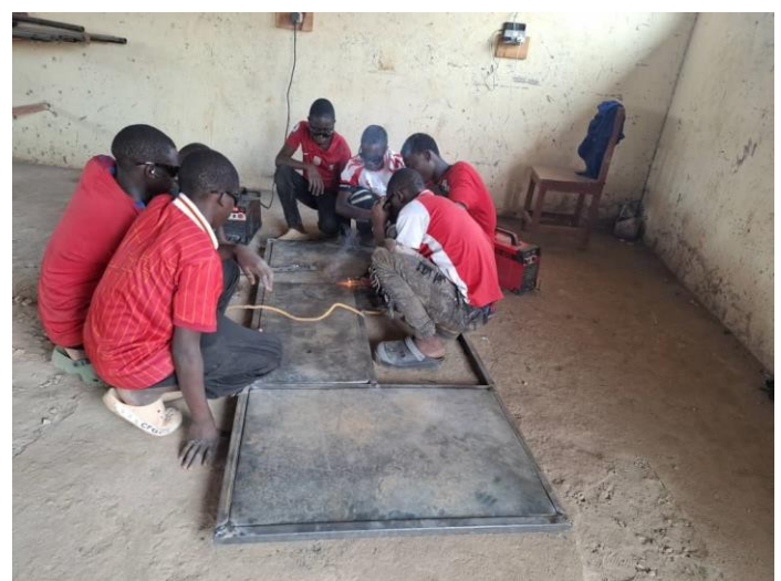
SCHÜLER IN DER SCHWEISSEREI